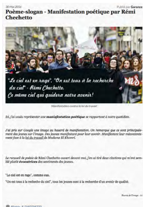
Illustration 3 : Extrait de page du blogue i-voix ( http://i-voix.net )