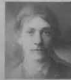
From 6 Members of same Family Male & Female.