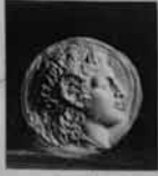
Alexander the Great From 6 Different Medals.