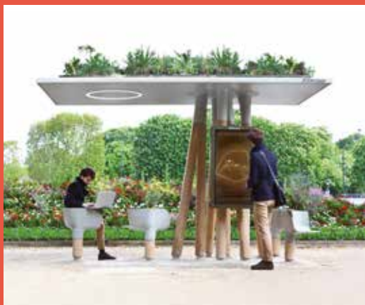
Dans le cadre d'un appel à projets lancé par la Ville de Paris, Google et JCDecaux expérimentent des innovations permettant de nouveaux usages sur l'espace public à travers plusieurs mobiliers urbains interactifs.