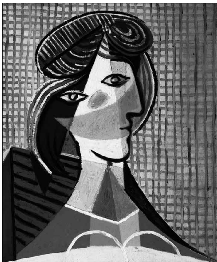
Pablo Picasso, Marie-Thérèse Walter, 1935.

Dans l'esprit de la recherche-action collaborative, l'équipe du projet IPEPI s'est attachée à analyser avec les enseignants et les parents d'élèves les effets des démarches plurilingues et interculturelles. La synthèse trop sommairement livrée ici rend compte des effets observés par ces acteurs au plus près du terrain.